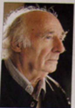
El poeta Jacques Roubaud.