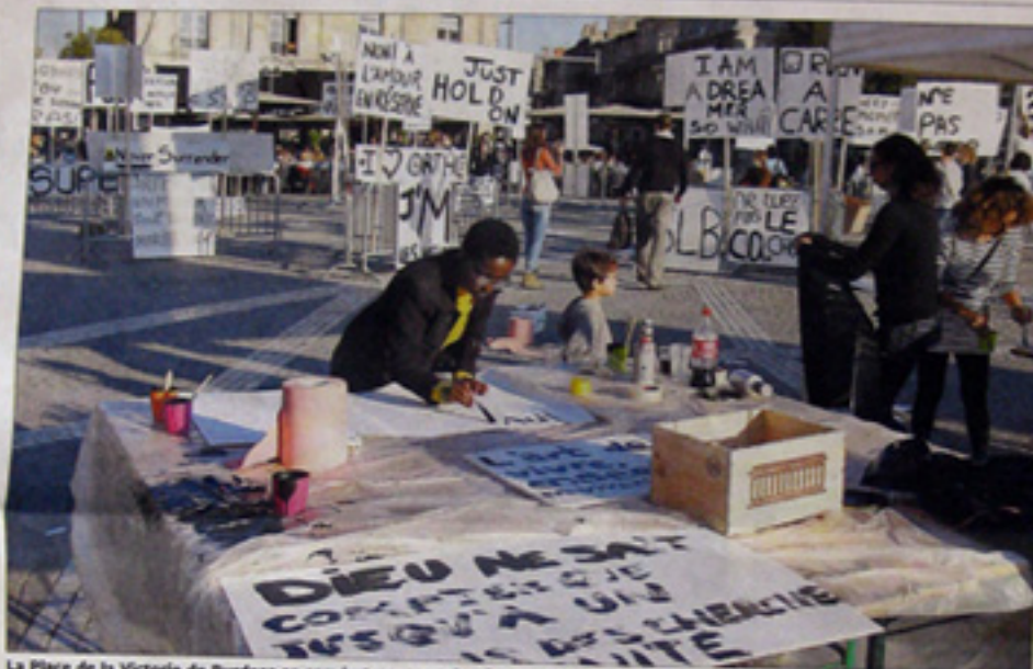
La Place de la Victoire de Burdeos se convierte en una plataforma al aire libre para el ingenio artístico.