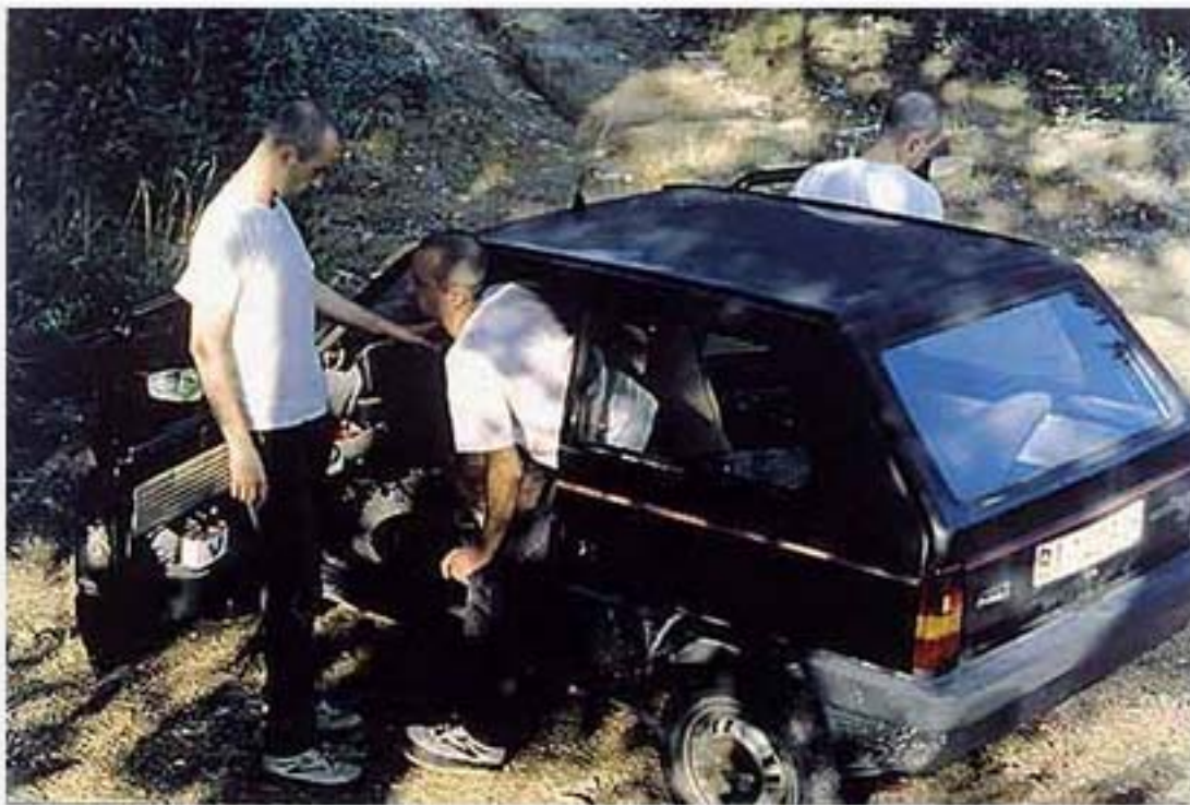
jon mikel euba

Les deux engagent leur image pour mieux se désengager, plus qu'une critique de l'image, ils révèlent la relativité des identités , individuelles et collectives.