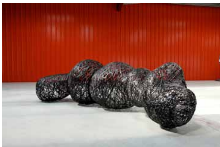
Œuvre réalisée lors du Pôle d'Art de Savoir au Présent à la SOFICAR avec le soutien de la Région Aquitaine et de la Communauté de Communes de Lacq

Issu d'une double formation en mathématiques et aux Beaux-Arts (Rennes et Nantes), il déploie des interventions multiples à la frontière de la sculpture, de l'installation, du mobilier urbain et de la photographie. Questionnant le rapport rationnel et fonctionnel à l'architecture et au mobilier urbain, l'artiste crée des sculptures qui mettent en jeu le rapport du spectateur à l'image, à l'usage et au paysage.